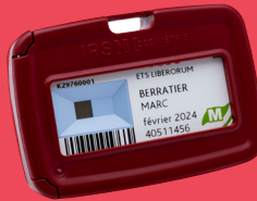
Dosimètre de criticité Mesure des fortes doses en situation accidentelle.