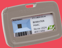
Dosimètre Étude de poste