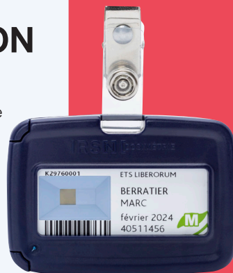
Dosimètre et coque réutilisables

Convertisseur en polypropylène pour augmenter la sensibilité aux neutrons rapides. (réactions (n,p))