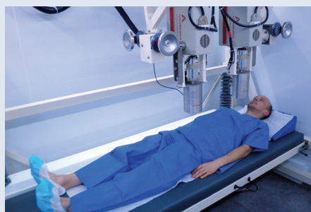
Laboratoire mobile d'anthroporadiométrie (LMA).